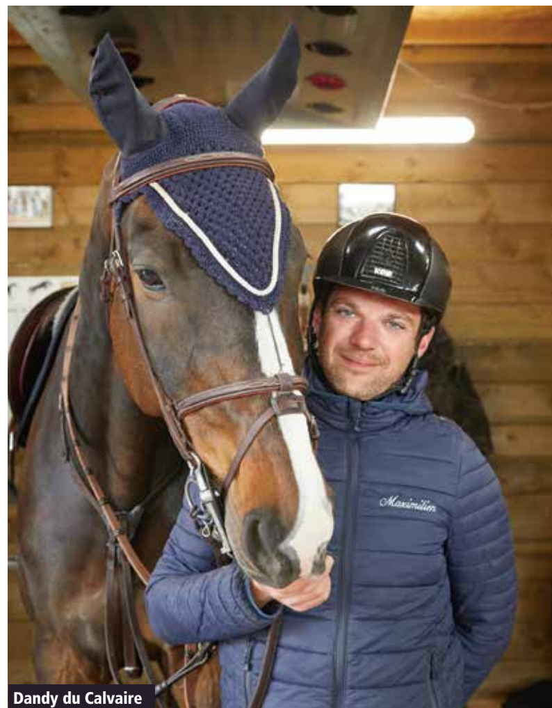
Dandy du Calvaire

Dès lors, les résultats se sont enchaînés malgré une blessure qui m'a mis au repos forcé durant toute une saison. Une convalescence qui a duré plus que nécessaire mais souhaitée par Maximilien au risque de griller sa carrière à haut niveau. Nous en sommes revenus plus forts ! Ensemble, nous avons arpenté les terrains internationaux durant plus de 10 ans avec de nombreux classements remarquables : sélection aux championnats d'Europe à Athènes, 5 e du championnat de France professionnel, 3 e du Grand Prix national de Vannes, vainqueur du Grand Prix d'Hardelot, 2 e du Grand Prix 3 étoiles de Royan, 2 e du Grand Prix de Chantilly, vainqueur de l'épreuve de vitesse de Maubeuge... Et bien d'autres !