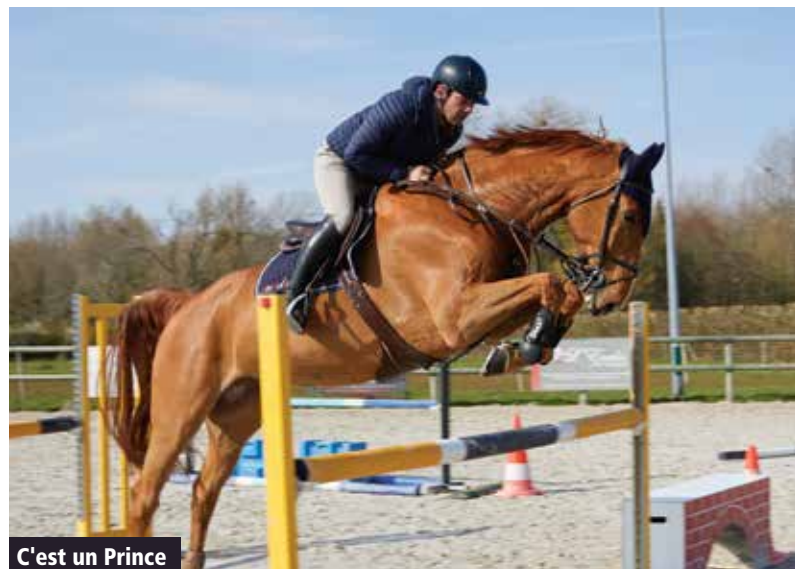
C'est un Prince