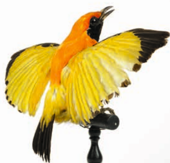
Jardinier du Prince d'Orange.

Des activités passionnantes sont en lien avec l'exposition. Rens. 14 rue Carnot, Saint-Omer - 0321380094 - www.musee-saint-omer.fr/programme/ Aider la Ligue de Protection des Oiseaux - https://pasdecalais.lpo.fr/