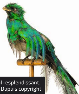
Oentzal resplendissant.

SAINT-OMER • Le musée Sandelin expose une remarquable collection d'oiseaux naturalisés et accompagne le visiteur dans les coulisses de leur reproduction.