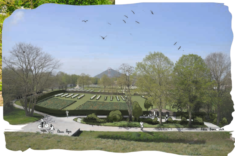
Illustrations SLAP Paysage / Valentin Bodoghien Architecture

Nombreux sont les descendants des soldats morts durant les deux guerres mondiales qui recherchent encore leurs aïeux. De nouvelles inhumations ont lieu régulièrement dans toute la France, et notamment dans le Pas-de-Calais, comme le 8 juin dernier au cimetière britannique de Loos-en-Gohelle. Ces cérémonies militaires sont d'une grande importance et d'une grande émotion pour les familles qui sont invitées à y prendre part.