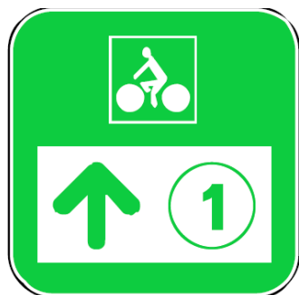
Exemples de panneaux de jalonnement directionnel d'un nœud (200 x 200)