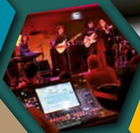
SCHÉMA DÉPARTEMENTAL Enseignements et pratiques artistiques en amateur